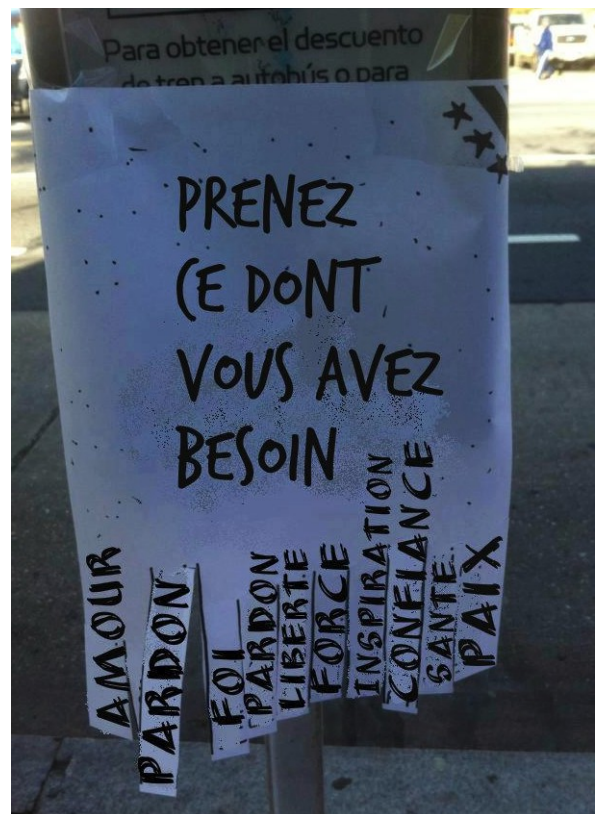
Message gratuit et poétique d'interpellation dans l'espace public.