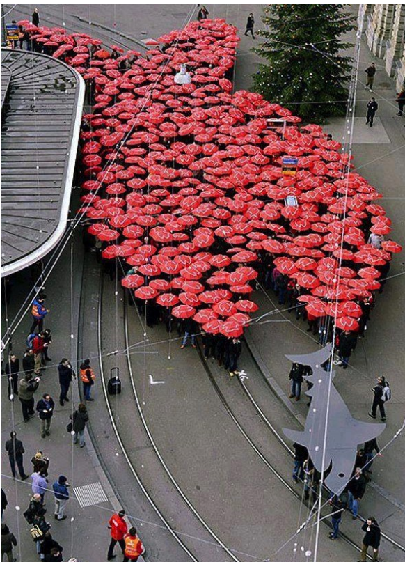
Manifestation créative contre des institutions financières