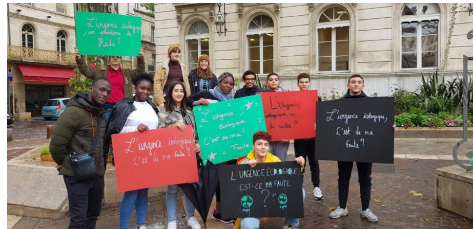
FCSF 2019 : Urgence écologique les jeunes s'engagent pour l'environnement